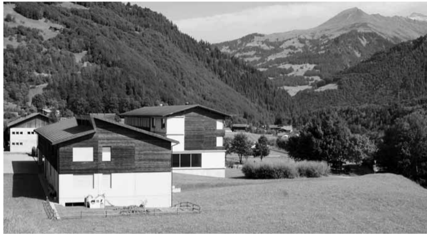
Der Bikepark soll neben den Schulhäusern im Feld, auf dem im rechten Bildrand zu sehenden Gemeindegrundstück realisiert werden.