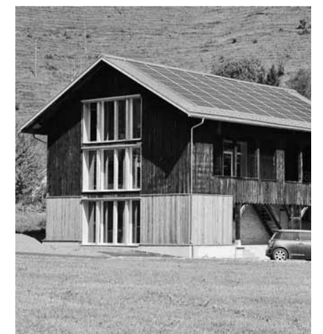
Wurde ausgezeichnet: Das Bürogebäude der Firma Züst Haustechnik.

Die Preisübergabe des Solarpreises findet anlässlich der Messe «Bauen und Modernisieren» am 4. September in Zürich Oerlikon statt und wird durch Bundesrätin Eveline Widmer-Schlumpf vollzogen. Die Auszeichnung bedeutet mehr als nur die Anerkennung des Pionierwerks. Durch den Preis wird das Gebäude zum Objekt verschiedener Studien von Forschungsstellen von Hochschulen. Und es ist durchaus möglich, dass Studierende an technischen Hochschulen und Universitäten Züst's Haus als Paradebeispiel für eine energieeffiziente Umnutzung in ihrem Stoff behandeln. Züst und die weiteren am Bau beteiligten Unternehmer können derzeit gar auf eine Nomination für den europäischen Solarpreis hoffen.