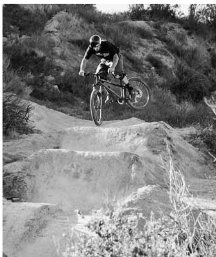
Pump Tracks bieten viel Spass, sowohl für Anfänger als auch für Fortgeschrittene